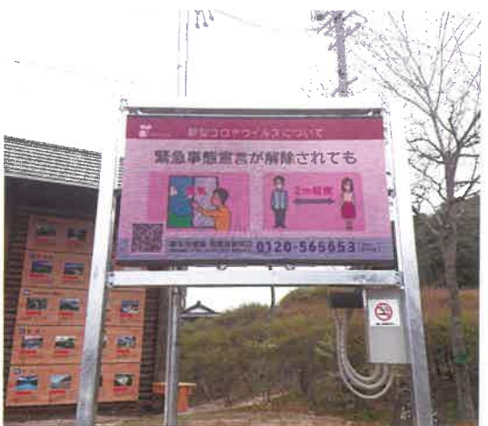
LEDデジタルサイネージ

市内には自然や歴史、食、スポーツといった誇るべき観光資源が点在しており、それら観光資源を有効活用した滞在型コンテンツを造成する取り組みを進めております。コロナ禍による旅行形式の変容に対応し、需要拡大が見込まれるアウトドアや自然資源、スポーツアクティビティなどの情報をSNSやメディアを活用したプロモーション活動により広くPRを行い、誘客につなげることで域内観光消費の活性化に努めてまいります。